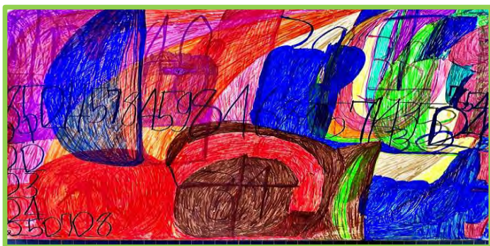
イラスト:「無題」関口由多可さん(愛泉園)