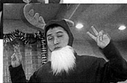
何でもやっちゃうヨ