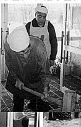
只今、大福もち作成中