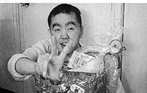
クリスマスはいいネー