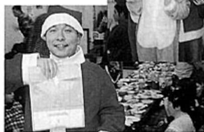
プレゼントはオレのもの