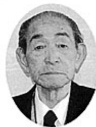
社会福祉法人白老宏友会