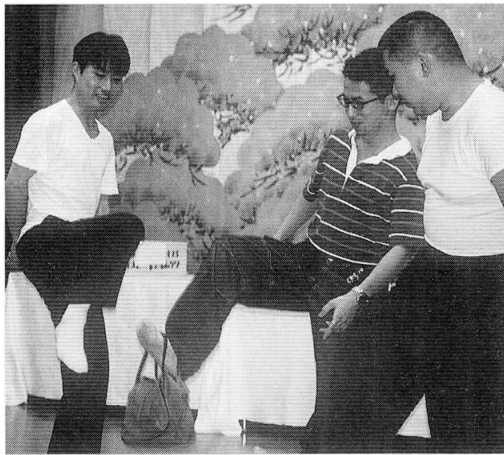
カバンリレーゲーム1