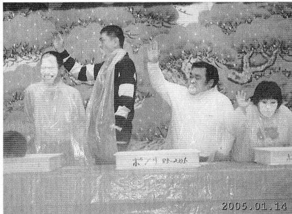
あめ玉さがしゲーム!!